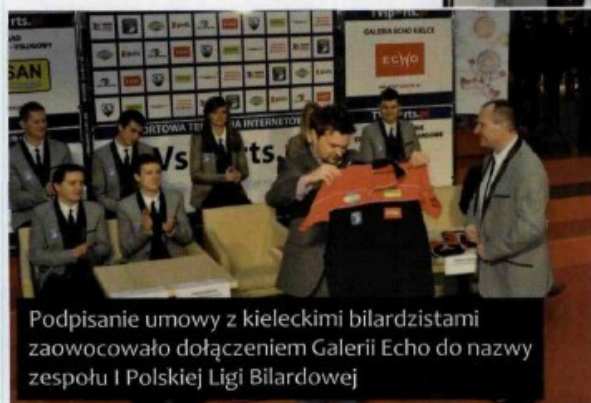
Podpisanie umowy z kieleckimi bilardzistami zaowocowało dołączeniem Galerii Echo do nazwy zespołu I Polskiej Ligi Bilardowej