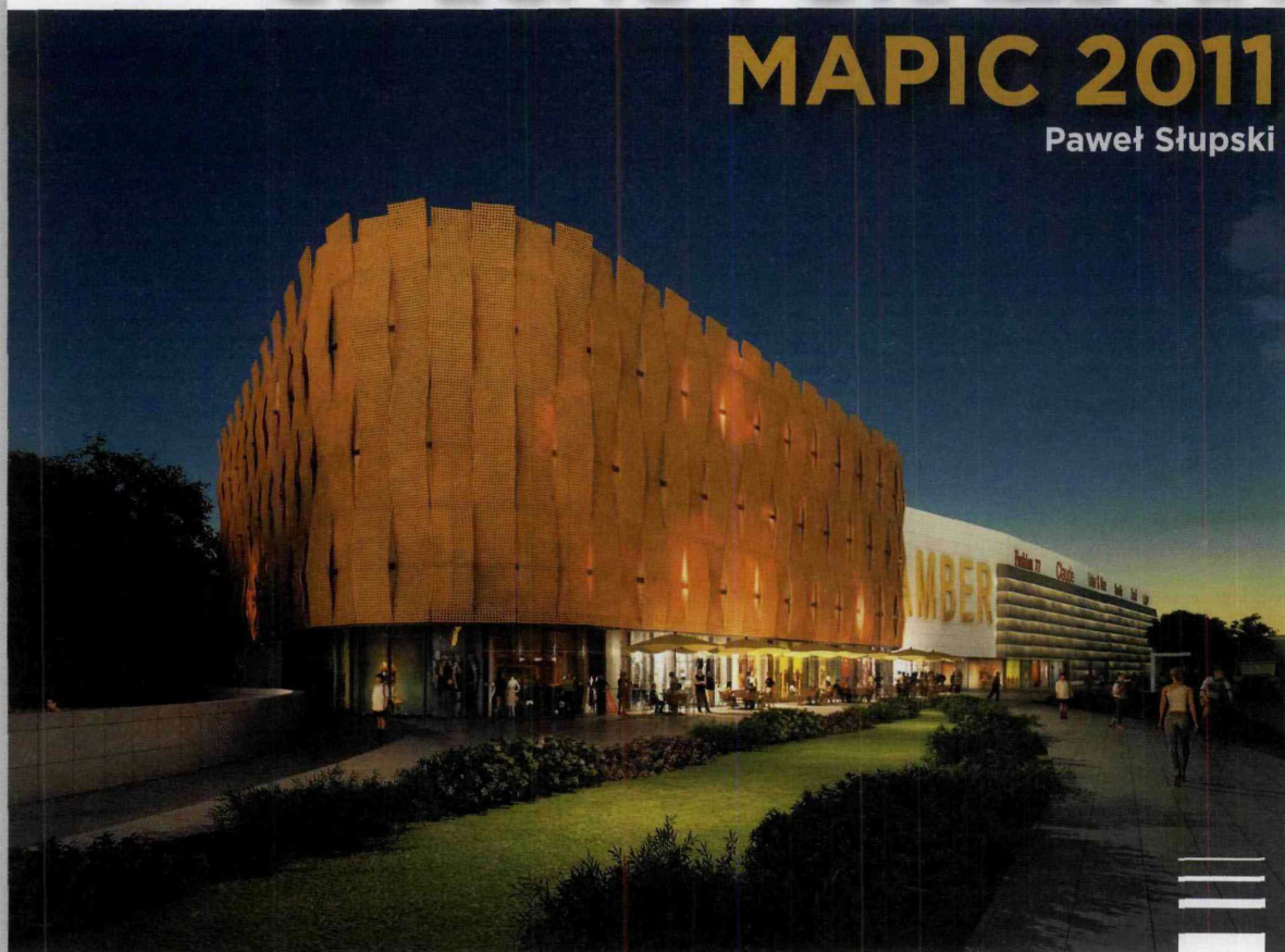
Galeria Amber w Kaliszu

Na tegorocznych targach nieruchomości komercyjnych MAPIC Echo Investment zaprezentuje dwanaście projektów realizowanych w Polsce, na Węgrzech i w Rumunii